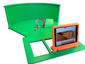
Een green screen

We zijn 2023 goed begonnen. Sinds kort zijn we in het bezit van een Green Screen Box. Dit is een mini theater waarmee kinderen zich digitaal in verschillende werelden kunnen verplaatsen. Dit nodigt uit om eigen verhalen te maken. Dit is goed voor hun taalontwikkeling, creatief denken, doorzettingsvermogen en samenwerken. Groep 8 heeft de eer om hier als eerste mee te mogen werken. Daarnaast verdiept groep 8 zich in hoe paalwoningen gemaakt zijn, waarbij moeilijke knopen gebruikt worden. Vervolgens ontwerpen zij hun eigen boomhut.